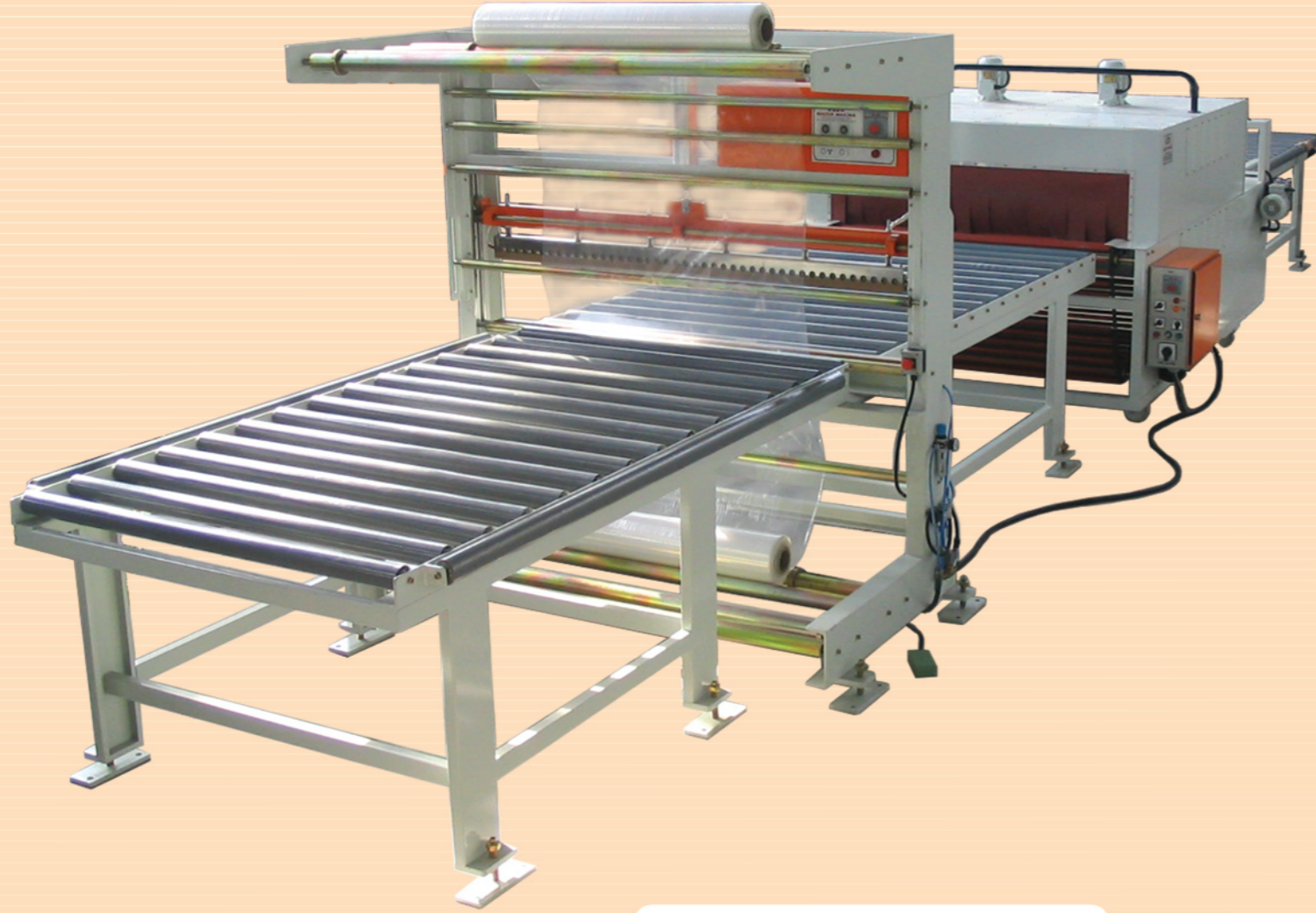
MT 2500 TAM OTOMATİK SHRINK MAKİNASI MT 2500 Full Automatic Shrink Wrapping Machine