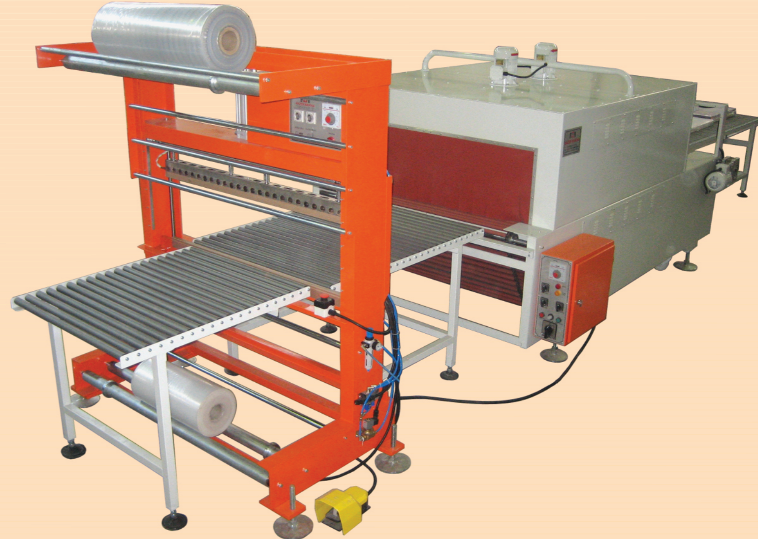
MT 1300 TAM OTOMATİK SHRINK MAKİNASI MT 1300 Full Automatic Shrink Wrapping Machine